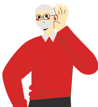
Dessin représentant monsieur avec un appareil auditif

Conséquences : difficulté dans la communication (lecture labiale, amplificateur à distance FM, Langage Parlé Complété, Langue des signes).