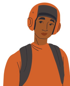
Dessin d'un jeune homme avec un casque de musique

Les troubles psychique peuvent causer une perte de conscience, une désorientation temporo-spatiale, une confusion mentale, des troubles des capacités relationnelles, des troubles de l'émotion et des troubles de l'humeur.