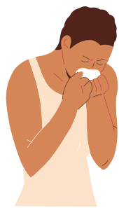
Dessin d'un garçon qui tousse dans un mouchoir