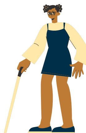
Dessin d'une jeune fille avec une canne

Ce handicap peut provoquer des difficultés de déplacements et/ou une incapacité totale ou partielle dans l'écriture et la lecture.