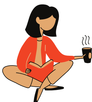
Dessin représentant une jeune fille qui lit un livre avec un café

Ces troubles peuvent affecter l'acquisition, l'organisation, la rétention, la compréhension ou le traitement de l'information verbale ou écrite.