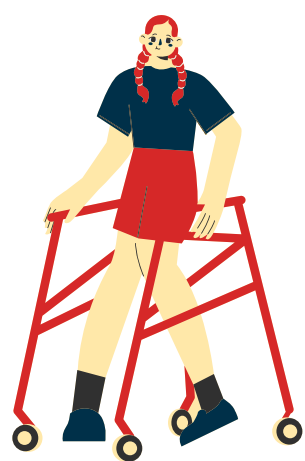
Dessin d'une fille avec une perte de motricité dans les jambes

Les conséquences de ce handicap sont des limitations fonctionnelles au niveau de la coordination des mouvements, de la locution, de la mobilité et de la dextérité.